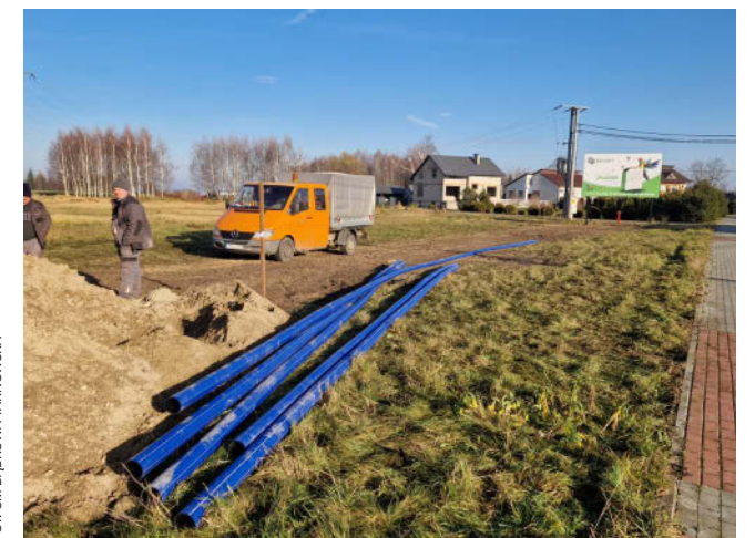
Budowa wodociągu w Morzychnie

Ponadto złożony został projekt na budowę kolejnego etapu kanalizacji w Smęgorzowie, projektowana będzie kanalizacja w Sutkowie. Gmina razem z RPWiK mają na uwadze dwie bardzo ważne inwestycje, tj.: roz-