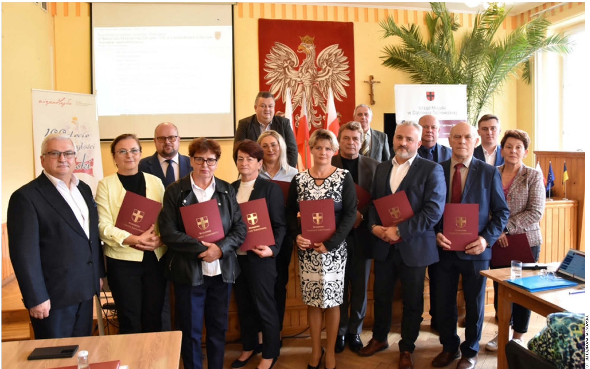
Nowi sołtysi. Sołtys jest przedstawicielem sołectwa - „najmniejszej Ojczyzny”. Jest on wspierany przez rady sołeckie.