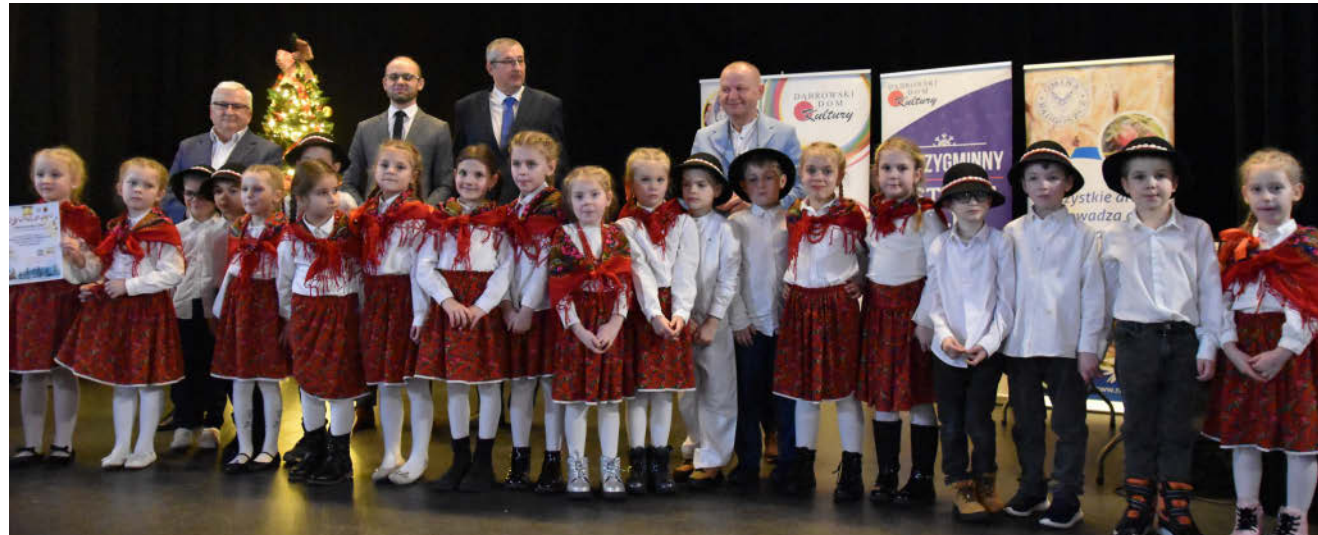
finał międzygminnego festiwalu kolęd

Plany na 2025 rok związane są na pewno w dużej mierze z kontynuacją cyklicz-