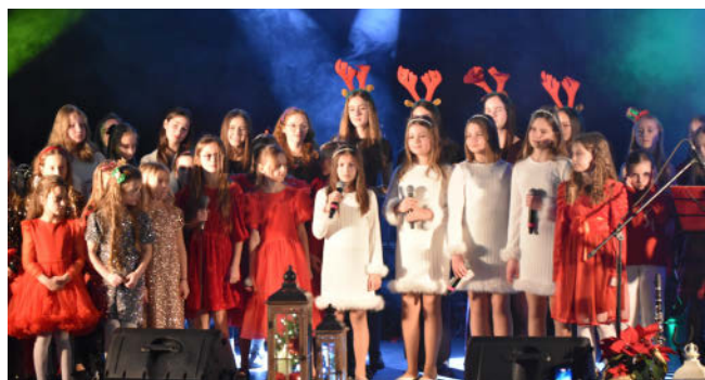
Koncert „W świątecznym nastroju” Agencji Artystycznej „Cantar”

Częścią DDK jest Uniwersytet Trzeciego Wieku, który oprócz swoich działań projektowych i statutowych wspaniale rozwija pasję filmoznawczą w ramach cyklicznych spotkań dyskusyjnych klubu „Sokole Oko”. Na pewno wspólnie z DDK studenci z UTW zaproszą mieszkańców na piękne koncerty w ciągu całego 2025 roku.