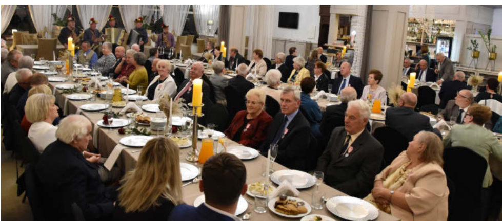
Jubileusz Złotych Godów

Dla wszystkich obecnych było to bardzo ważne i wzruszające wydarzenie, które zapewne zapadnie w pamięć naszym Jubilatom na długi czas!