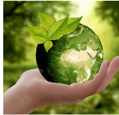
Bądźmy bardziej eko. Planeta nam się odplaci