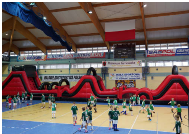
Dmuchana arena mikołajkowa