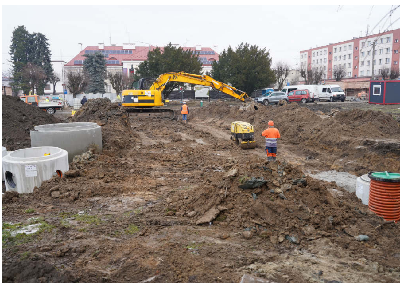
Dzięki wpływom podatkowym możemy realizować nowe inwestycje w naszej gminie