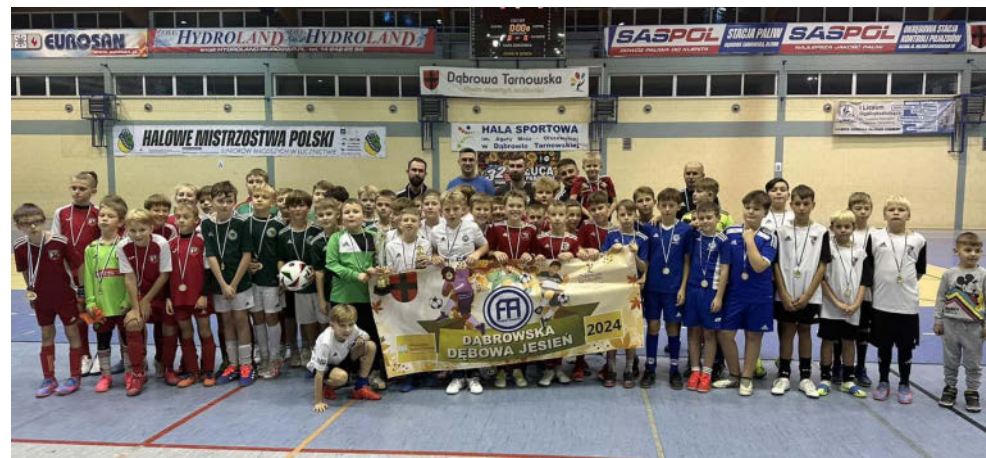
Dąbrowska Dębowa Jesień