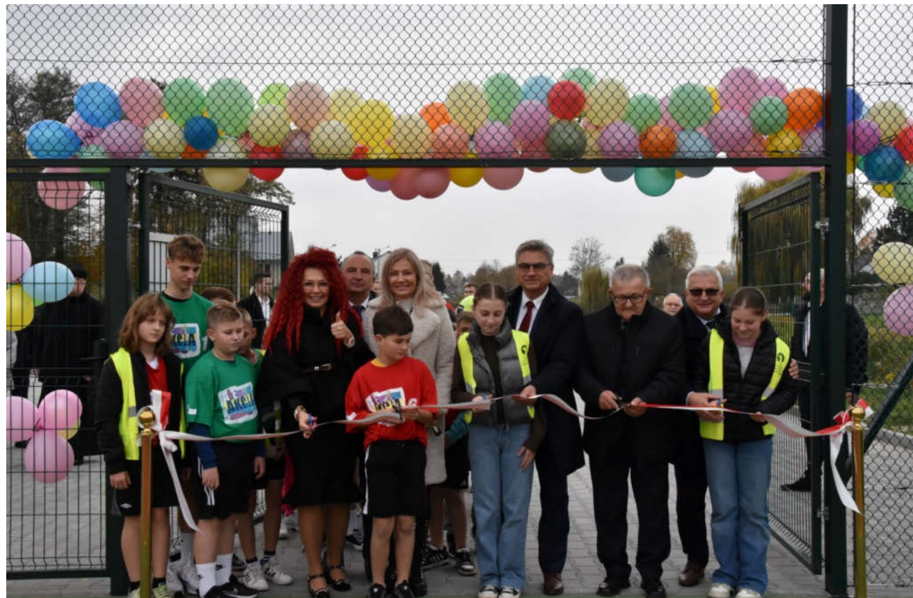
Otwarcie boiska w Żelazówce

Jest to kolejna inwestycja w infrastrukturę sportową przeprowadza w tym sezonie, bowiem gmina realizowała również zadanie polegające