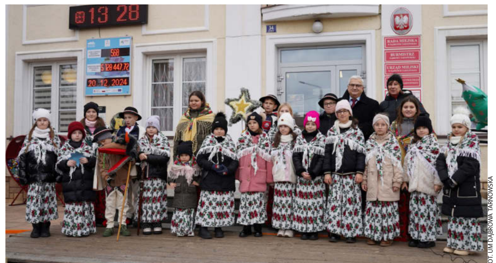
Rynek przez cały dzień tętnił życiem