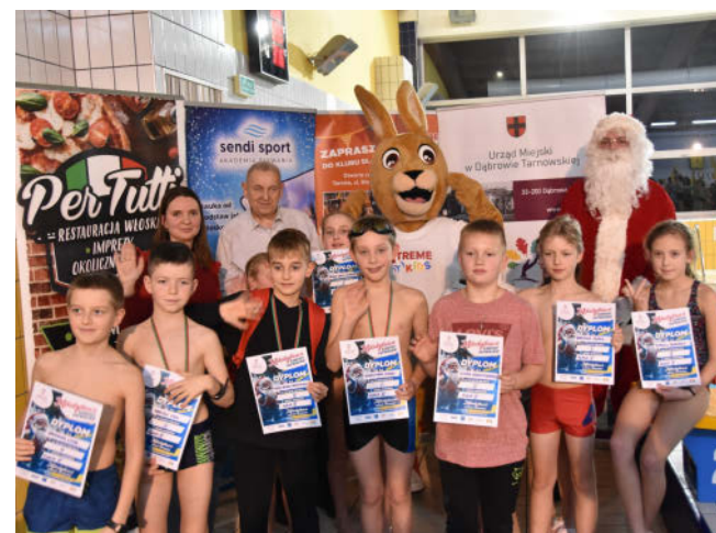
Mikołajkowe zawody pływackie