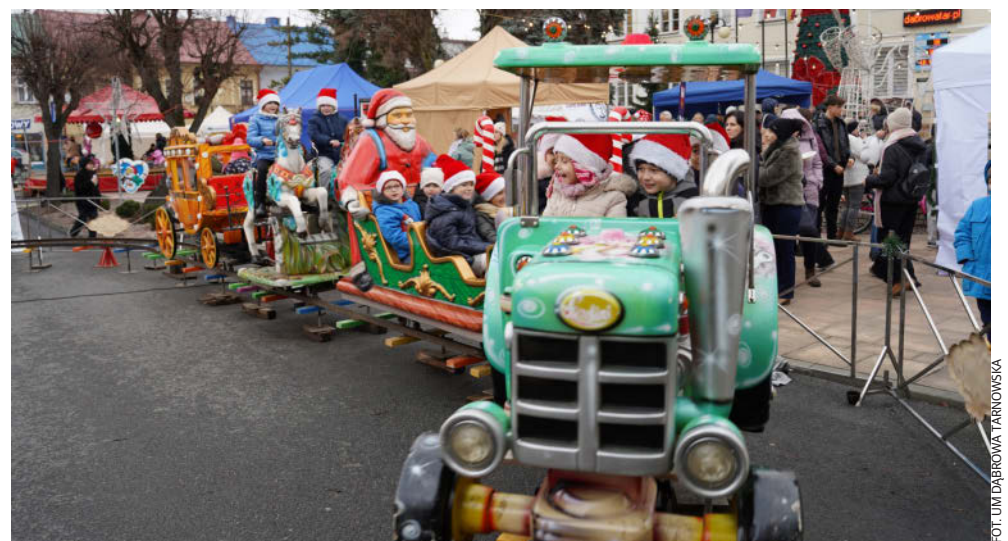
Podczas kiermaszu można było skorzystać z darmowych atrakcji takich jak wesołe miasteczko