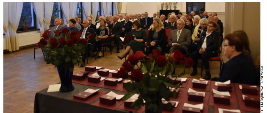
Jubilaci otrzymali listy gratulacyjne i upominek

Miejski Ośrodek Pomocy Społecznej i Wsparcia Rodziny w Dąbrowie Tarnowskiej (dalej MOPSiWR) w 2024 r. poza działaniami wynikającymi z ustawy o pomocy społecznej, prowadził szereg dodatkowych zadań.