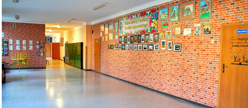
Korytarz w Szkole Podstawowej nr 3 im. Bohaterów Powiśla Dąbrowskiego

W Szkole Podstawowej w Nieczajnie Górnej w ramach programu „Posiłek w szkole i w domu” wyremontowano jadalnię wraz z zapleczem ku-