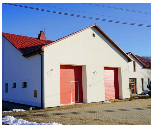
Wielofunkcyjny budynek będzie sprzyjał organizacji imprez i wydarzeń kulturalnych

W powstających lokalach ma w przyszłości zostać zlokalizowana filia Miejskiej Biblioteki Publicznej w Dąbrowie. Ponadto miejsce to ma stać się domem dla lokalnego Koła Gospodyń Wiejskich oraz Zespołu Pieśni i Tańca Nieczajnianie.