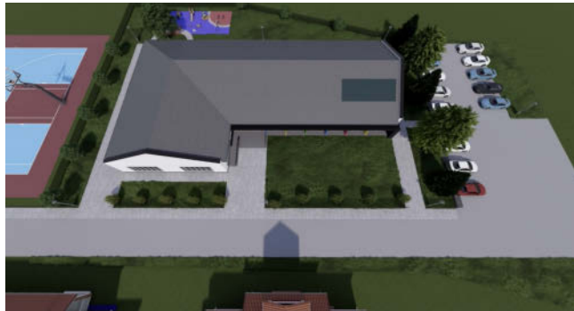
Projekt publicznego żłobka wraz z infrastrukturą techniczną w Dąbrowie Tarnowskiej. Szacowany koszt to ok. 5 mln zł

● Blisko 1 milion złotych przeznaczony zostanie na budowę sieci wodociągowej i kanalizacyjnej na terenie miasta i w obszarach wiejskich. Ponadto w przypadku uzyskania