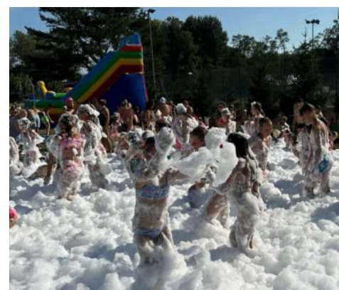
Piana Party na basenie sezonowym