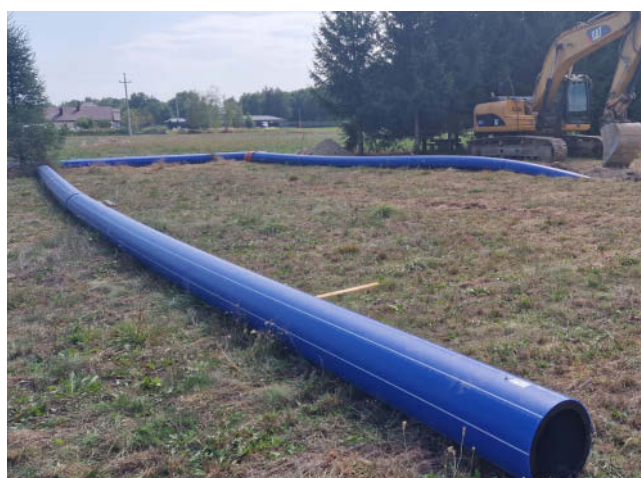
Modernizacja magistrali wodociągowej

W 2024 roku Rejonowe Przedsiębiorstwo Wodociągów i Kanalizacji w Dąbrowie Tarnowskiej uruchomiło wywóz nieczystości ze zbiorników bezodpływowych, jak również z przydomowych oczyszczalni ścieków. Odpowiadając na apel