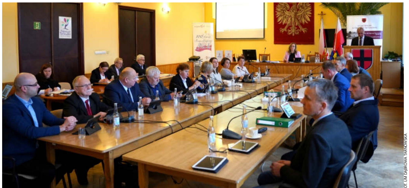
Nowa Rada Miejska w Dąbrowie Tarnowskiej