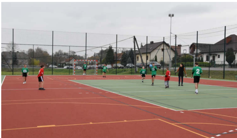
Boisko sportowe w Żelazówce