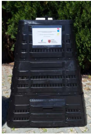
Kompostownik dla mieszkańców w ramach programu „Zaopatrzenie gospodarstw domowych w kompostowniki na terenie Gminy Dąbrowa Tarnowska”

Od 2025 roku wszedł w życie obowiązek selektywnego zbierania odpadów typu: tekstylia (odzież, obuwie, pościele itp.). Na terenie naszej gminy odpady typu tekstylia są przyjmowane na PSZOK-u przy ul. Jagiellońskiej. Na terenie miasta i sołectw znajdują się również liczne pojemniki ustawione przez organizacje zajmujące się charytatywnym zbieraniem odzieży, gdzie można oddać tekstylia nadające się do użytku.