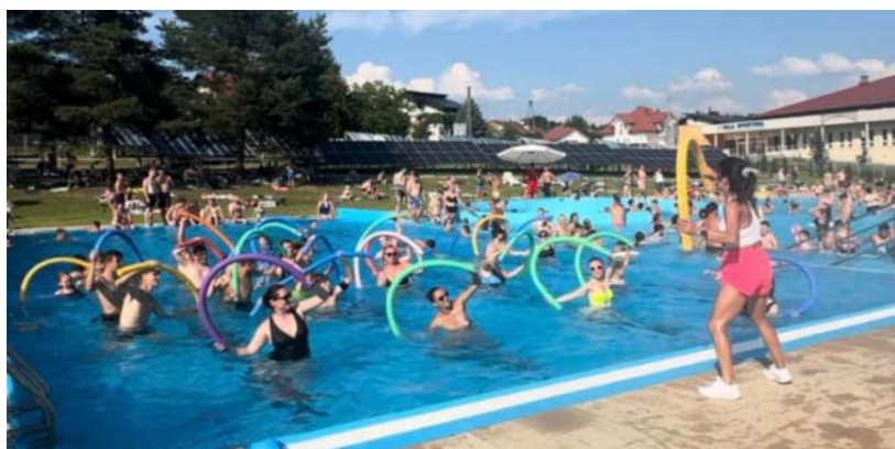
aqua areobic na odkrytym basenie