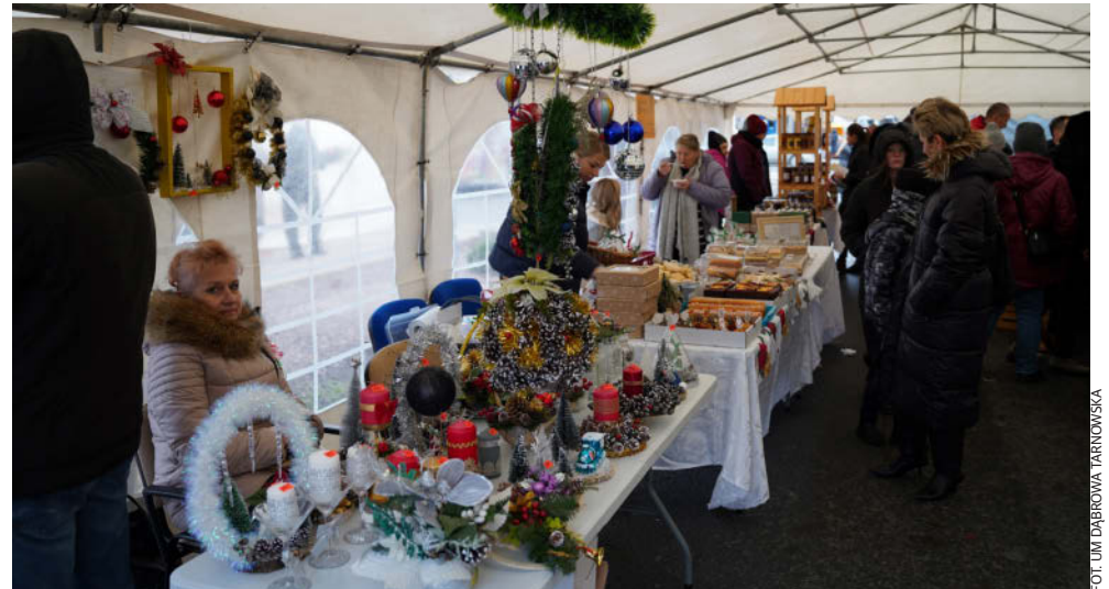
W ciągu całego dnia na 50 stoiskach można było znaleźć wszystko, co potrzebne na święta

Za rok kolejny kiermasz w podobnej formule, który mamy nadzieję, że odbędzie się na zrewitalizowanym rynku. Już teraz deklarujemy, że organizatorzy zaskoczą nas kolejnymi atrakcjami i ciekawym programem.