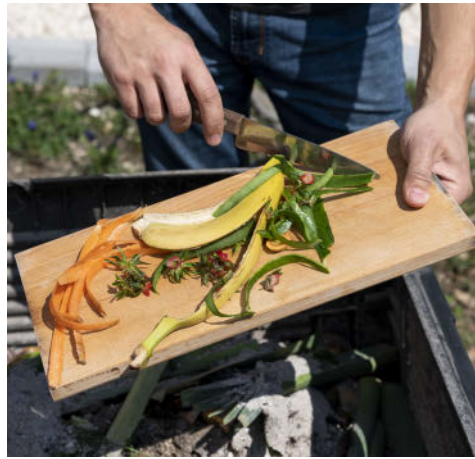
Kompostowanie jest łatwe...

Opłata za gospodarowanie odpadami komunalnymi na terenie gminy naliczana jest od ilości osób zamieszkałych i wynosi 27 złotych lub 25 zł