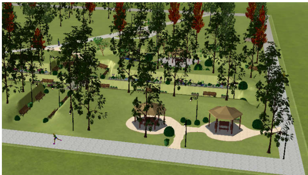
Wizualizacja parku miejskiego