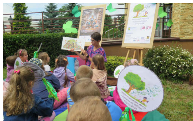
Czytanie na Polanie