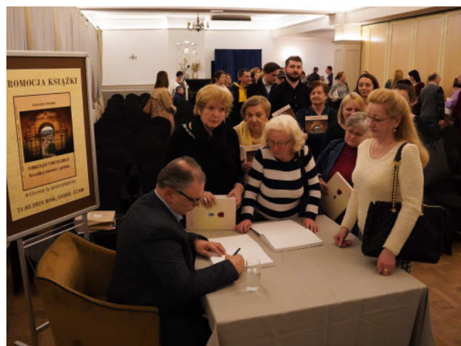
Promocja Kroniki miasta i gminy

W 2024 roku Miejska Biblioteka Publiczna im. Marii Kozaczkowej w Dąbrowie Tarnowskiej po raz kolejny przedstawiła swoim czytelnikom niezwykle różnorodną ofertę czytelniczą i kulturalną