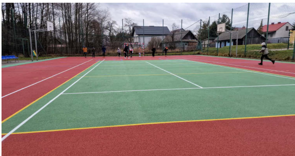
Boisko w Lipinach

Dodatkowo zaplanowano montaż nowych urządzeń sportowych, takich jak bramki i kosze do koszykówki, a także prace związane z modernizacją ogrodzenia, w tym wymianę wybranych elementów.