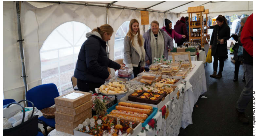
Smakołyków nie brakowało