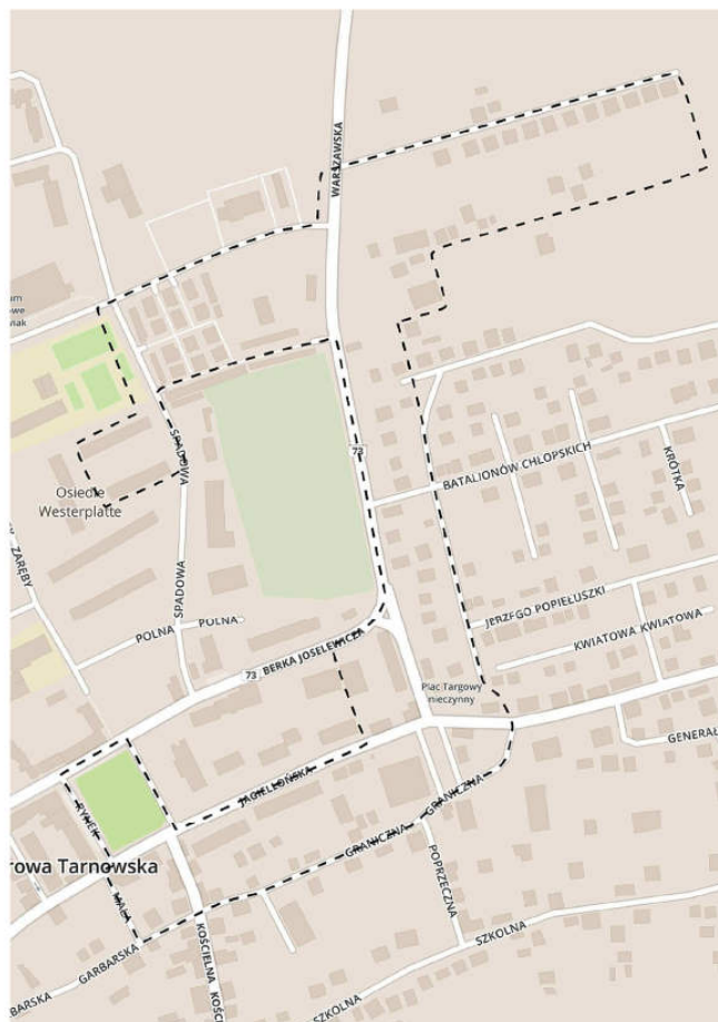
Obszar Centrum Miasta Dąbrowa Tarnowska

2. Okolice Osiedla Kościuszki (obszar osiedla nr 1 w Dąbrowie Tarnowskiej) o powierzchni 38,9 ha i liczbie mieszkańców równej 687.